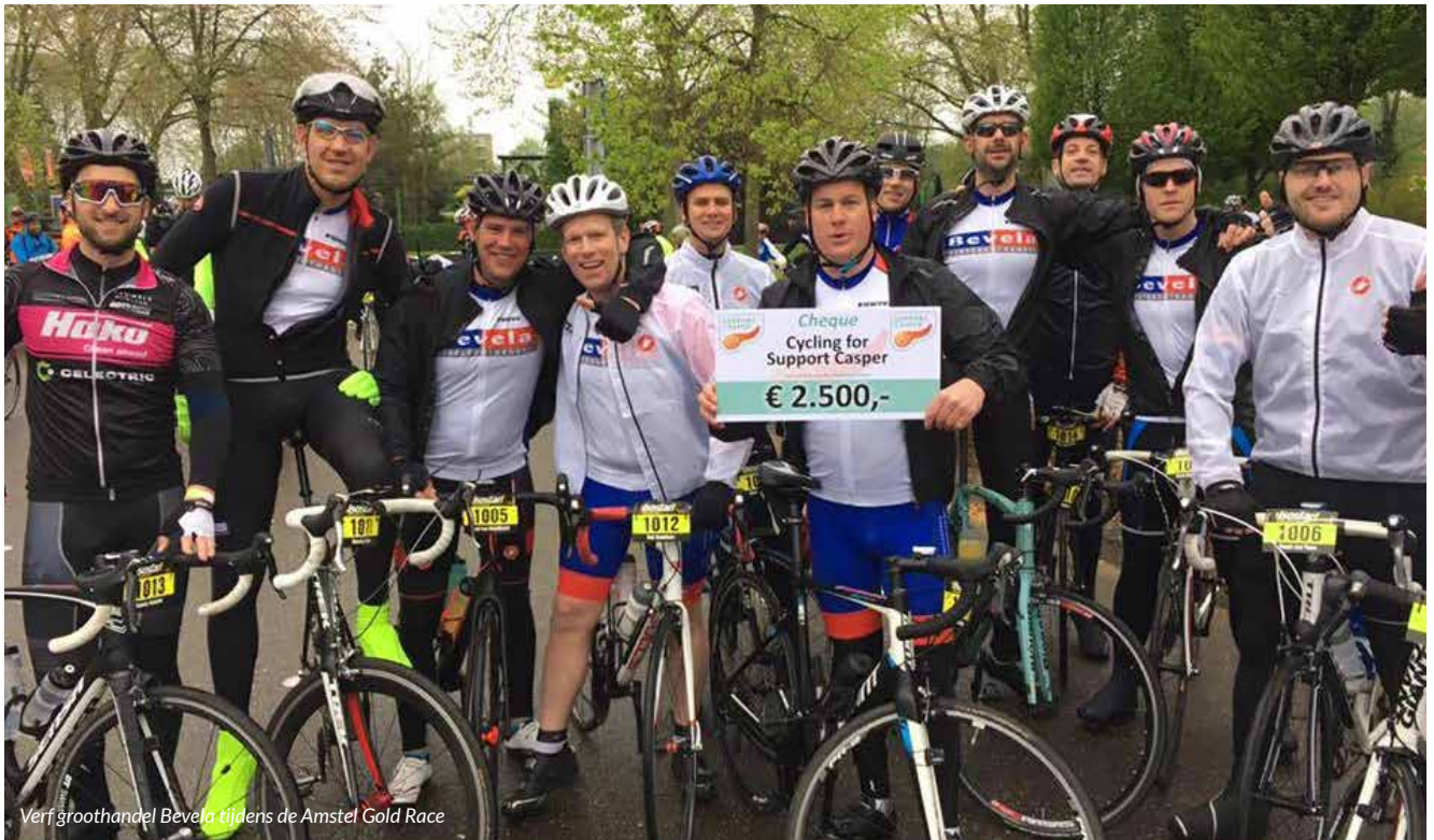
Verf groothandel Bevela tijdens de Amstel Gold Race