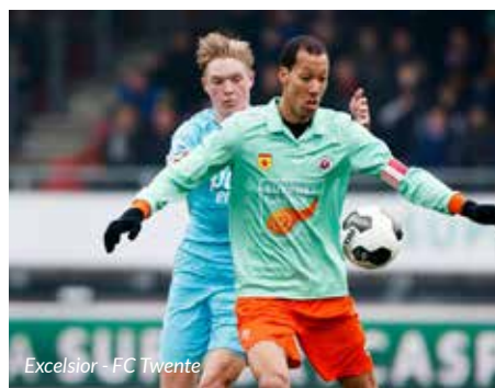
Excelsior - FC Twente

Op 1 maart startte via het actieplatform de actie 'Casper en Casprientje'. Twee lammetjes werden genoemd naar onze chirurg Casper van Eijck. In 2016 kocht Femke Maurits bij Hetty van Riessen in Almere het schaap Happy. Op 11 januari kreeg Happy een lammetje die de naam Casper kreeg. Toen er bij Hetty een lammetje werd geboren werd ook die naar Casper vernoemd: Casprientje. Ondersteunt door filmpjes op Facebook hebben beide lammetjes geld ingezameld: € 5.550.