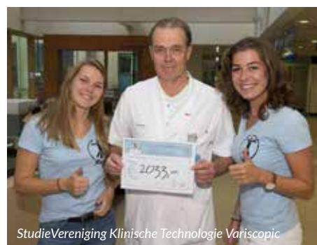
StudieVereniging Klinische Technologie Variscopic