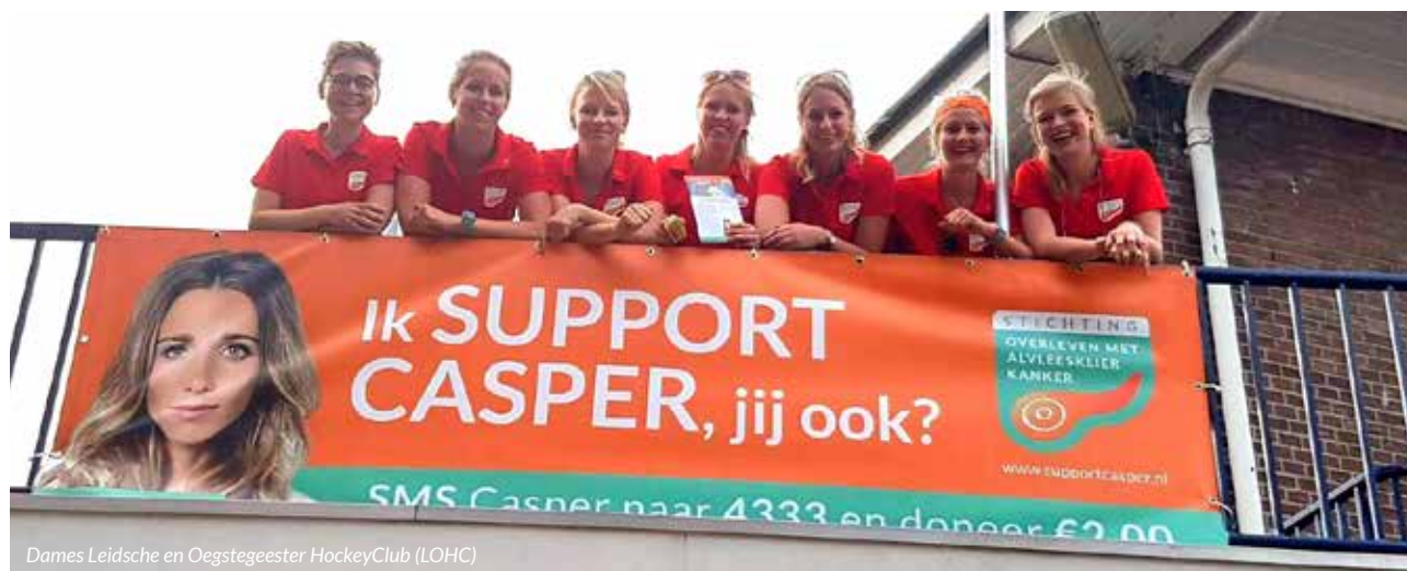
Dames Leidsche en Oegstegeester HockeyClub (LOHC)

Door het actief inzetten van onze ambassadeurs bij activiteiten en evenementen wordt de aandacht gefocust op ons onderzoek. Ook ontstaan daarbij nieuwe acties zoals het voorlezen van een dictee door Astrid Joosten bij een benefietavond voor ons goede doel van een Lions, Rotary of Ronde tafel.