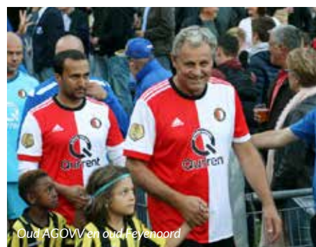
Oud AGOVV en oud Feyenoord