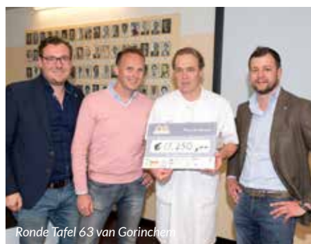
Ronde Tafel 63 van Gorinchem