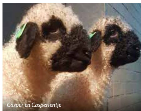
Casper en Casprientje