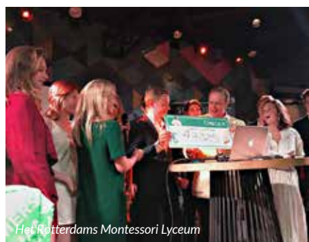
Het Rotterdams Montessori Lyceum