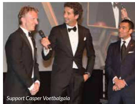
Support Casper Voetbalgala